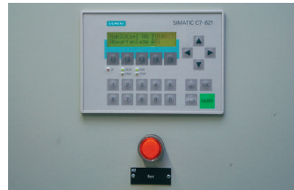
Mikroprozessor-Steuerung, Bedienung Commande à microprocesseur