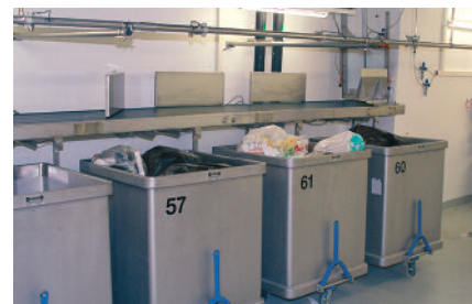
Förderanlage mit Gurtförderer und Pushern Installation de transport à ruban et arrêts