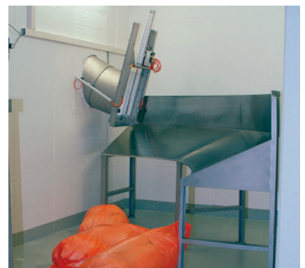
Auslaufrutsche mit Sackbremse Glissière de décharge avec dispositif de freinage des sacs