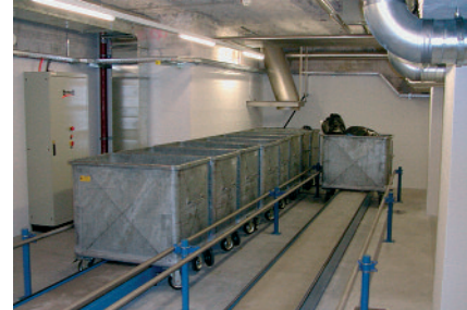
Container-Verschiebeanlage Installation de transport de containers