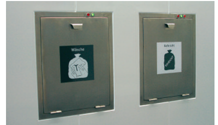
Zertifizierte Brandschutztüre EI30 VKF Z10539 Portes certifiées coupe-feu EI30 AEAI Z10539

Le système de freinage des sacs à la sortie du dévaloir empêche ceux-ci d'éclater lorsqu'ils tombent d'une grande hauteur. Les tabliers des containers diminuent les désagréments dus aux odeurs et aident à remplir correctement les containers.