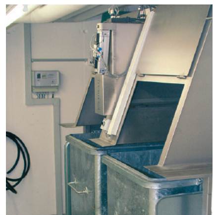
Auslauf mit Doppel-Containerschürze Sortie avec double tablier de container