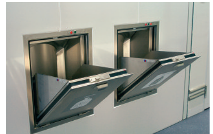
Brandschutztüren für Wäsche und Kehricht Portes coupe-feu pour le linge et les déchets